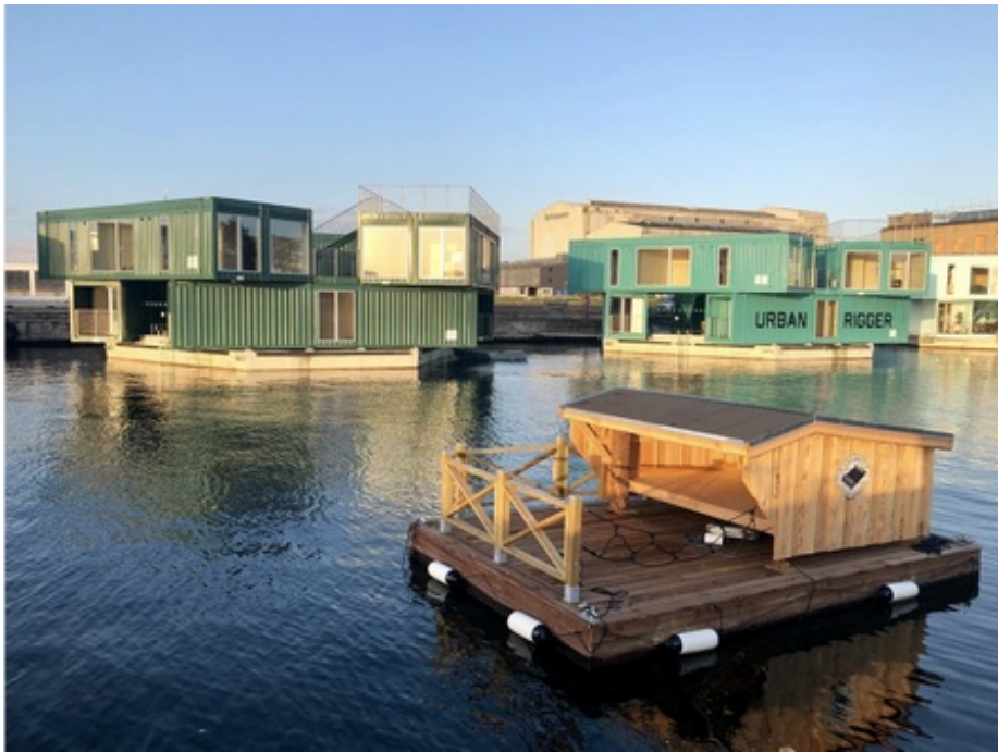
Det Flydende Shelter.

Naturpark Amager er stadig i udvikling, og har netop fået en ny bevilling , bl.a. til samlingspunktet ved Havnslusen. Vi følger spændt med i planerne for naturparken.