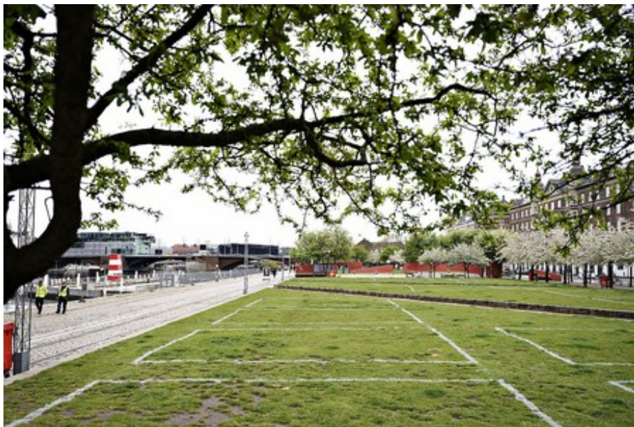
Kridtafmærkninger på havnefronten ved Islands Brygge.

I begyndelsen af måneden blev opholdsforbuddet på Islands Brygge ophævet . I stedet er der kommet kridtafmærkninger på havnefronten af 40 kvadratmeter, hvor max 10 personer må opholde sig. Måske kan lignende løsninger være en del af årets Kulturhavn Festival?