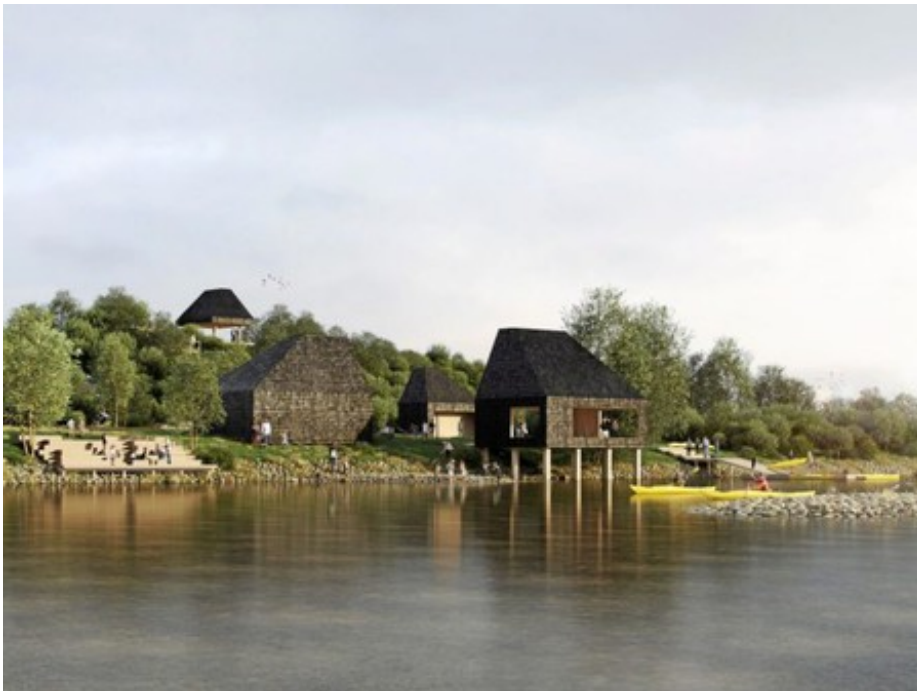
En foreløbig visualisering af det nye samlingssted ved Havnslusen. Foto: Møller & Grønborg og ADEPT.

Naturpark Amager er stadig i udvikling, og har netop fået en ny bevilling , bl.a. til samlingspunktet ved Havnslusen. Vi følger spændt med i planerne for naturparken.