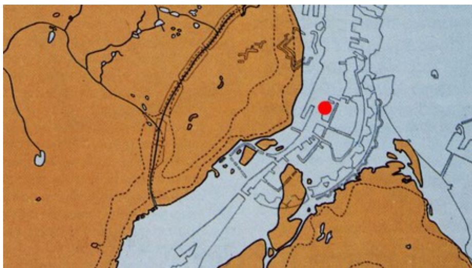
Københavns Havn anno 1428. Illustration: Københavns Museum

Til sommer bliver det muligt at se vragedelene fra et skib , der blev sænket helt tilbage til dengang da Erik af Pommern var konge af Danmark. Nu er skibet nemlig, efter mange års konservation, kommet til Københavns Museum, hvor det bliver en del af deres udstilling om havnens historie.